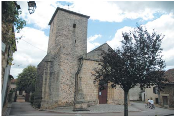
Eglise de Chaillac-sur-Vienne